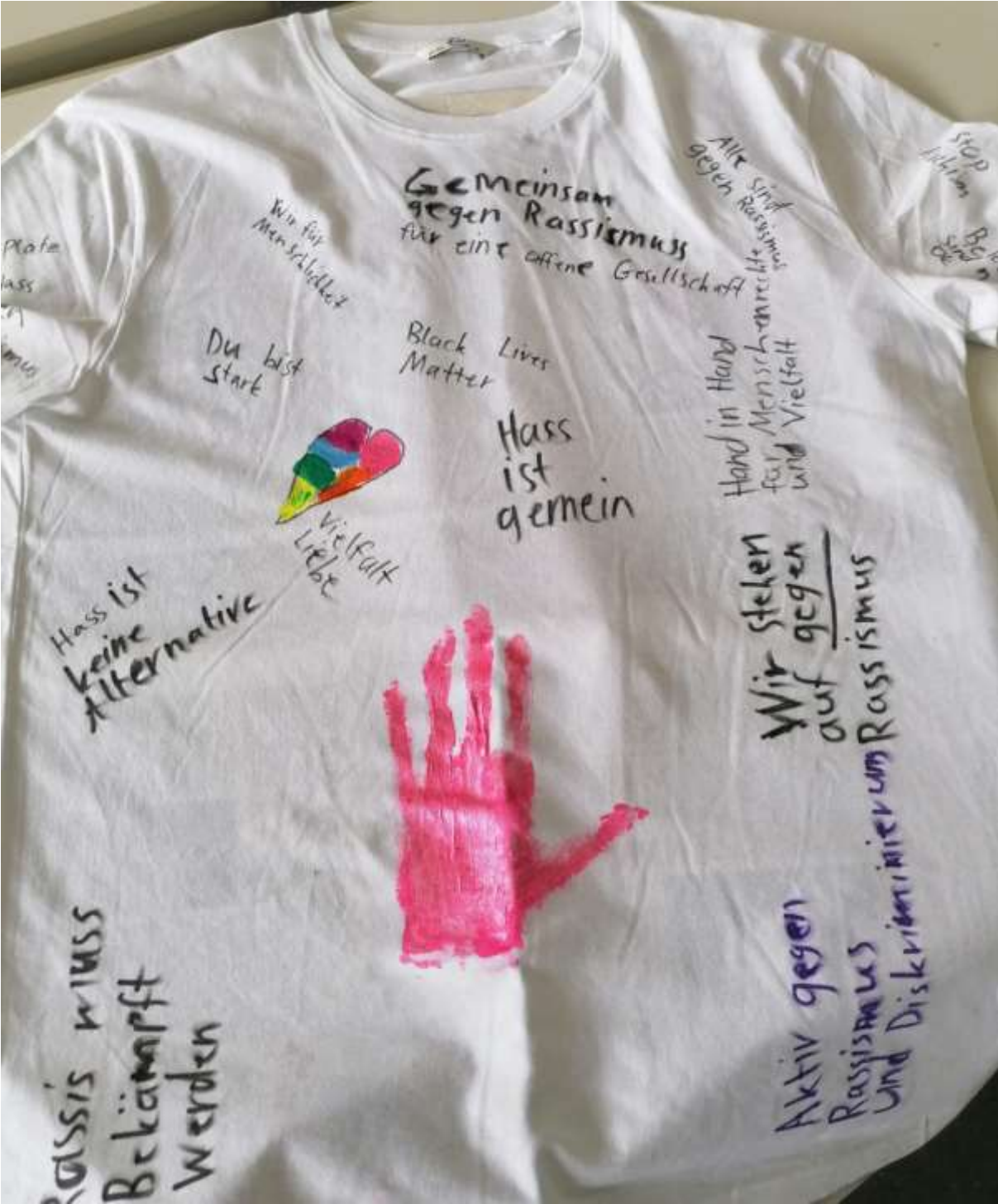
plate rass in mus