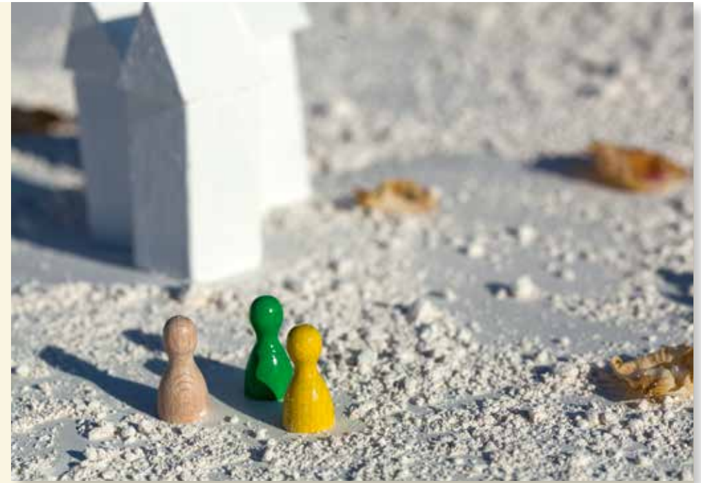
عروض عقارية بمنطقة دائرة كايزرسلاوترن

http://www.kaiserslautern-kreis.de/verwaltung/jugend-und-soziales/188/wohngeld.html